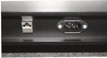
Sockel hinten: integrierte Anschlüsse für Strom und LAN